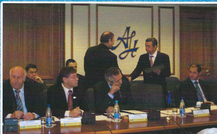
Было проведено торжественное вручение Свидетельств новым членам Союза.