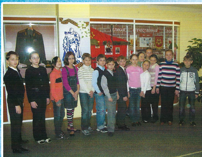
Проведение наглядного урока истории.

В музее представлены подлинные экспонаты времён Великой Отечественной войны 1941-1945 г.