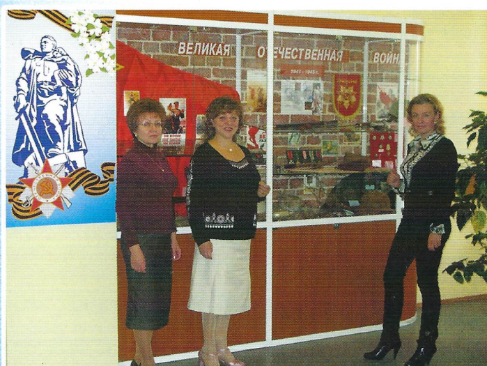
Перед открытием экспозиции.