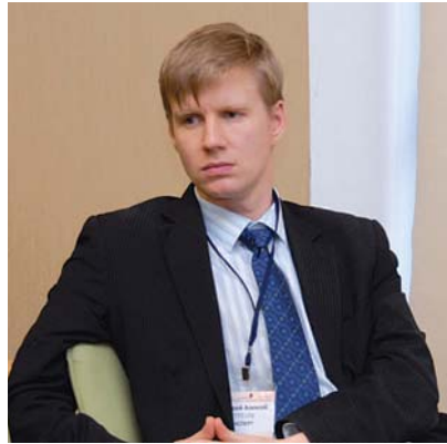
Алексей Бакирей, Директор Департамента государственной политики в области автомобильного и городского пассажирского транспорта Министерства транспорта РФ

В ходе дискуссии замминистра рассказал об организации перехватывающих парковок в городах-участниках Чемпионата. Для болельщиков планируется организация парковок «Park-and-Ride», на которых они смогут оставить свои автомобили и там же пересесть на общественный транспорт. Будут созданы перехватывающие парковки, предназначенные для временного размещения транспорта, места их расположения пока прорабатываются. В случае если места стоянок будут находиться на удалении от основных магистралей, где курсирует общественный транспорт, станут использоваться автобусные шаттлы, доставляющие зрителей от места парковки до пунктов. Там они смогут пересесть на регу-