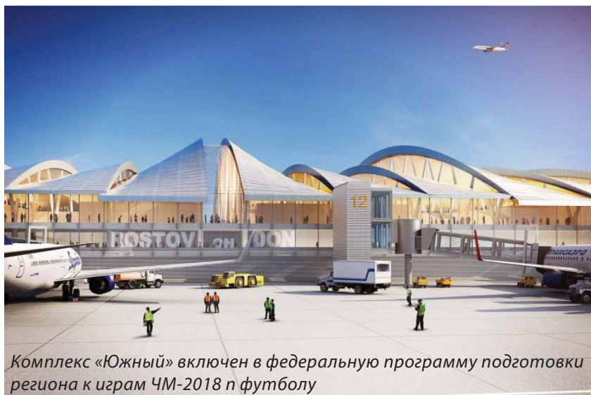
Комплекс «Южный» включен в федеральную программу подготовки региона к играм ЧМ-2018 по футболу

Н. Асаул особо отметил, что в настоящее время работы во всех 11 городах-организато-