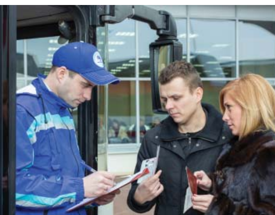
Проверка документов при посадке в автобус

Гости мероприятия коснулись и актуальной проблемы борьбы с нелегальными перевозчиками. Сергей Собянин со-