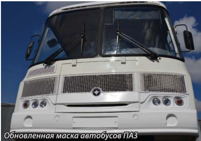
Обновленная маска автобусов ПАЗ