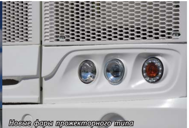
Новые фары прожекторного типа

Итак, какие же основные изменения в экстерьере произошли в новых моделях серий ПАЗ-3205, ПАЗ-3206, ПАЗ-4234?